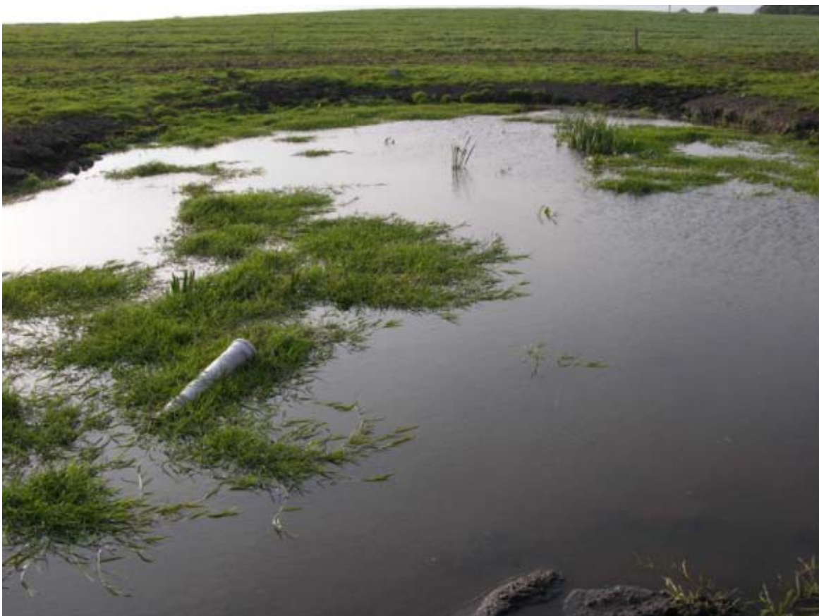
Foto fra den kommunens besigtigelse i 2010 i forbindelse med den generelle § 3-registrering af beskyttet natur i kommunen