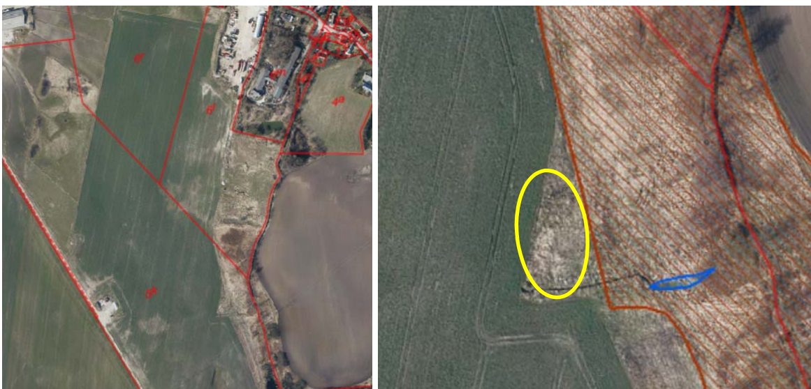
Kortbilag 2: Luftfoto fra 2021. Placering af erstatningslokalitet.