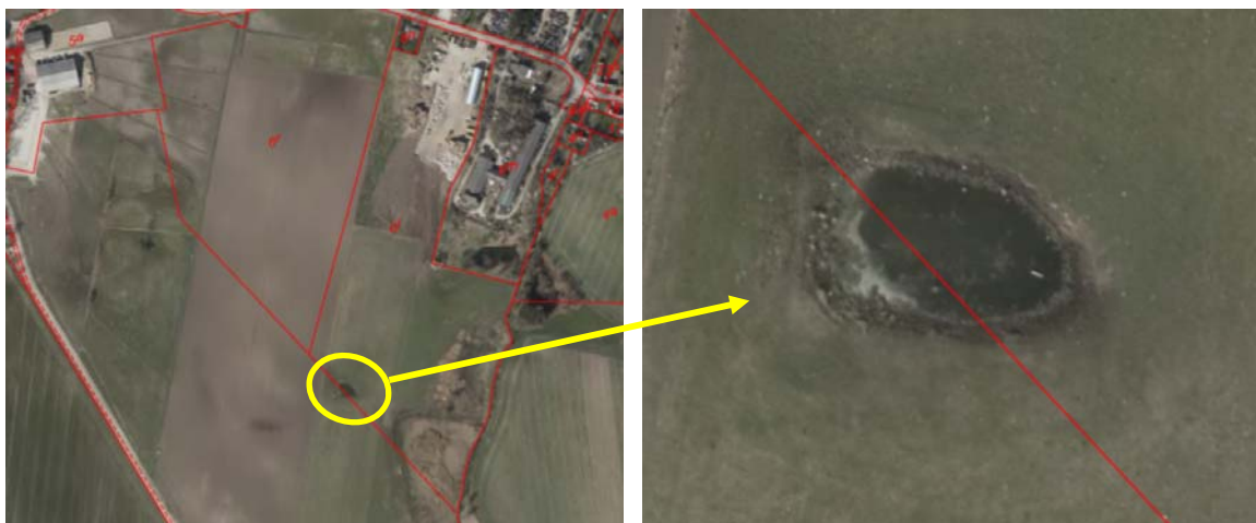
Kortbilag 1: Luftfoto fra 2014 af vandhullet, før det blev nedlagt